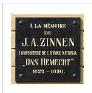
Stad Lëtzebuerg: d'Plack um Knuedler