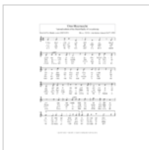
Partitur vun der Stad Lëtzebuerg: de Heemecht.