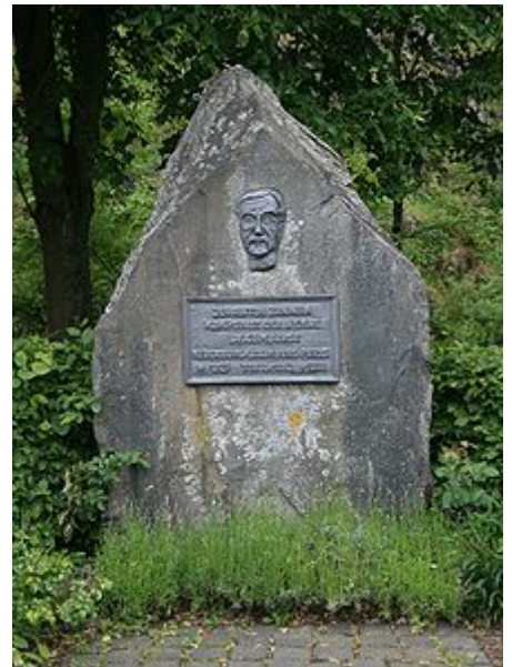
Gedenksteen op der Zinnen-Plaz an der Neierbuerg.

Vu senge Kompositiounen ass Ons Heemecht natierlech déi bekanntst; si gouf de 5. Juni 1864 zu Ettelbréck fir d'éischt opgefouert. Mä och 2 Operetten, Märsch, Kantaten a Lidder huet hie geschriwwen.