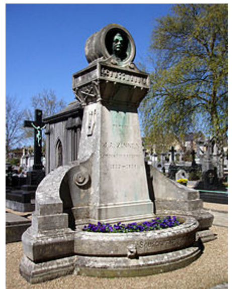
Graf vum J. A. Zinnen um Nikloskierfecht. D'Monument gouf mat Hëllef vun enger nationaler Souscriptioun opgeriicht.