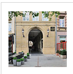
Stad Lëtzebuerg: de Passage de l'hôtel de ville um Knuedler, mat riets uewen der Plack zur Erënnerung un de J.-A. Zinnen